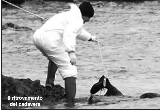
Il ritrovamento del cadavere